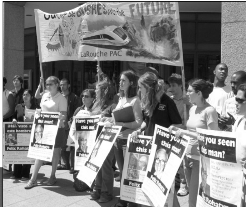
"Out of the Bushes, into the Future" (ung. Ut ur bushen, in i framtiden). Under en aktionsvecka i Washington DC i april gick LaRouches ungdomsrörelse på synarkistbankiren Felix Rohatyn för hans sabotage av en ny FDR-politik i USA.

Att kongressen inte ingrep då har nu lett till en situation där 65 stora bilfabriker med en verktygsmaskinkapacitet på mer än 7 miljoner kvadratmeter kommer att slå igen under detta år och