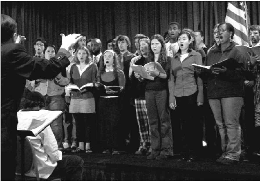
Ungdomskören framför J.S. Bachs Jesu, meine Freude -motetter under Lyndon LaRouches webcast den 16 november.

tad återindustrialisering av Berlin. Med en beslutsam, revolutionär ungdomsrörelse lyckades vi skapa en masseffekt som på sina ställen bröt igenom massmediernas totala kontroll på vad som får sägas. Vi sågs på alla möjliga platser runt om i staden. Vi sjöng och delade ut flygblad i tunnelbanorna. Vi diskuterade med medborgarna vid varje gathörn. Vi knackade dörr och hade stora köer ute i mörka förortsområden, där den försummade delen av befolkningen bor. Vi tog över de väl inövade skendebatterna mellan de "etablerade" kandidaterna och introducerade inte bara den verkliga situationen för stadsborna, utan även den lösning som nu måste tillämpas.